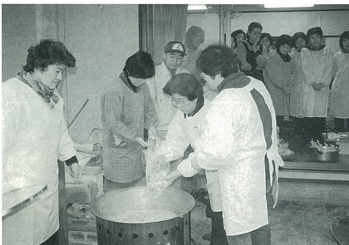
大きな鍋での炊飯や豚汁作りに挑戦