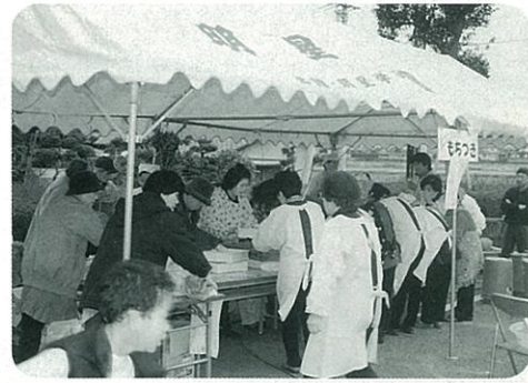
カルチャーセンター玄関前