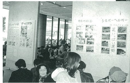
カルチャーセンター内