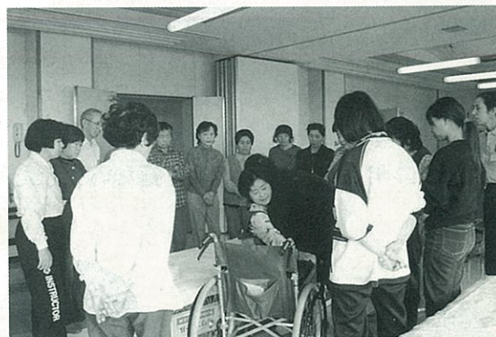
▲家庭看護講習会 車椅子からベッドへ… なかなか難しいですね