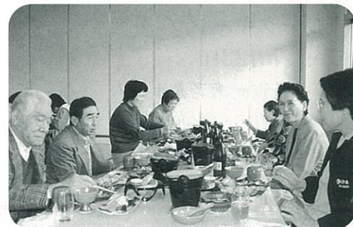
◀ 在宅介護者のつどい 日頃の介護疲れも一時忘れて…