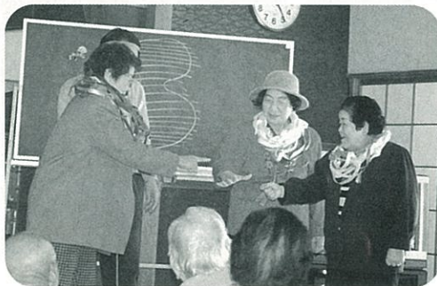
▲ 一人暮らし高齢者のつどい 「ゲームで勝ったらハワイ行きだゾー!!!」