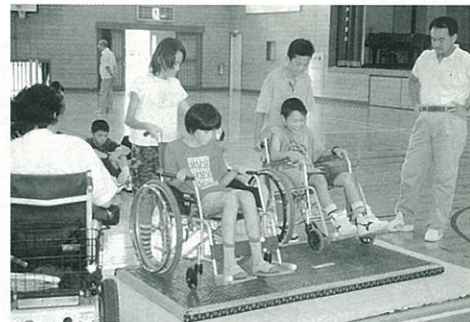
◀ ボランティアスクールで 車椅子体験を学習