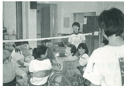
▶ ワークキャンプ 利用者の方々と風船バレーを楽しむ中学生