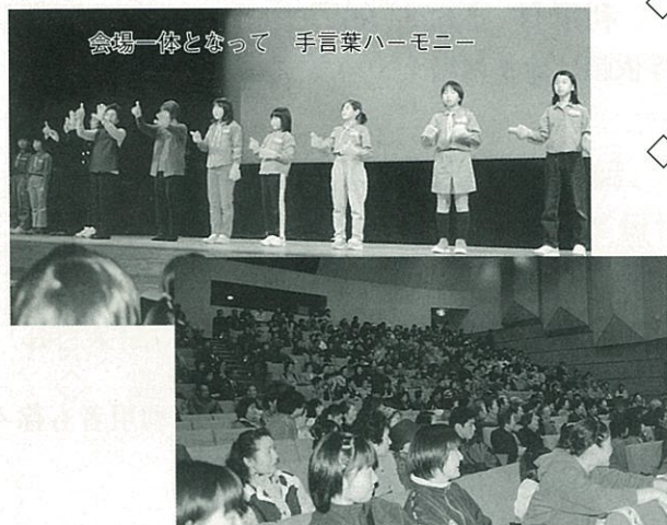
▲「第4回ボランティアのつどい」 参加者でいっぱいになった会場内