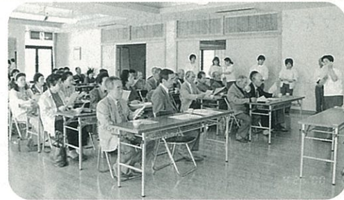
◀ 高齢者相談員研修風景 (グリーンヒルみふね)