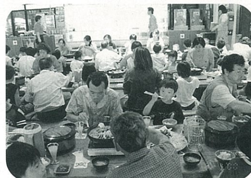
◀ 阿蘇ファームランドで 大好きなバーベキューに舌つつみ