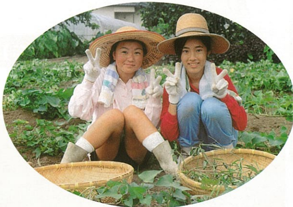
第二明星学園で利用者と一緒に園外活動