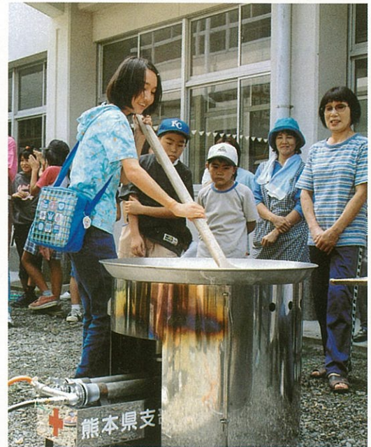
大釜で悪戦苦闘の子供達