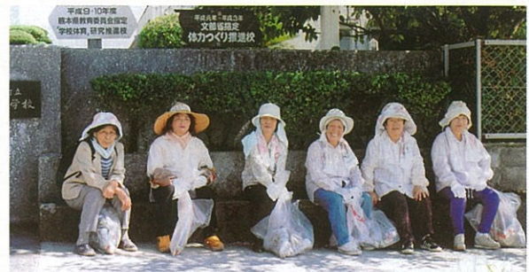
環境美化活動中！ ちょっと一息…