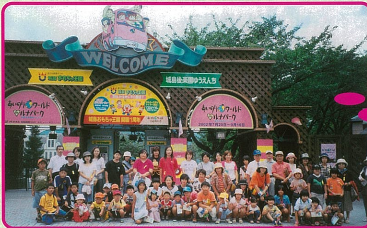
母子父子一日旅行

※昼食、入場料、バス代、フェリー代、旅行保険は社協で負担します。ただし、お申し込みが80名になりましたら受付を締め切らせて頂きます。