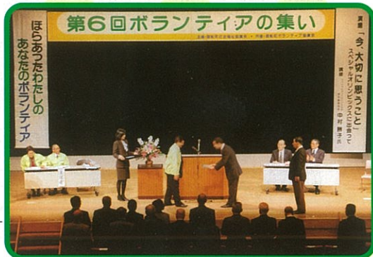
6回目となる「ボランティアのつどい」も盛大に行なわれました。