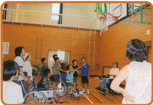
なかでも、車椅子バスケットが一番人気！

毎年夏休み期間中恒例になっている小学・中学・高校生のボランティアスクール、ワークキャンプは総勢182名の参加がありました。