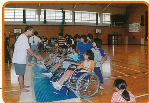
ヒューマンネットワーク熊本の皆さんの熱心な車椅子指導は、すごくわかりやすく、障害者の方の生の声が聞けて大変勉強になりました。

毎年夏休み期間中恒例になっている小学・中学・高校生のボランティアスクール、ワークキャンプは総勢182名の参加がありました。