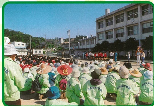
御船高校とボランティア連絡協議会合同による環境美化活動を行いました。