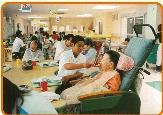
中、高校生は施設で食事介助などの介護体験を行います。