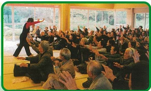
孤独感の解消と交流を行ない、親睦を図っています。