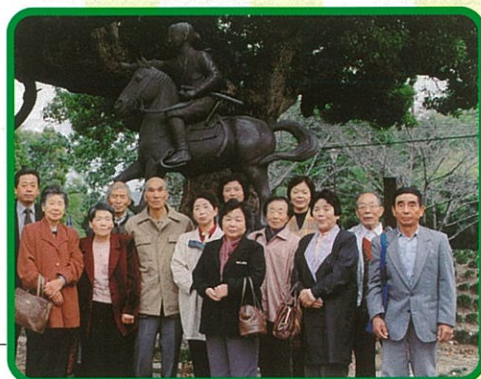
在宅で介護されている家族の心身のリフレッシュを目的に実施しています。