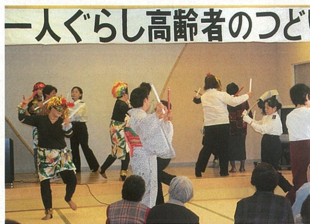
木倉婦人会によるアトラクション