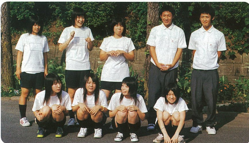
ワークキャンプに参加した御船高校生