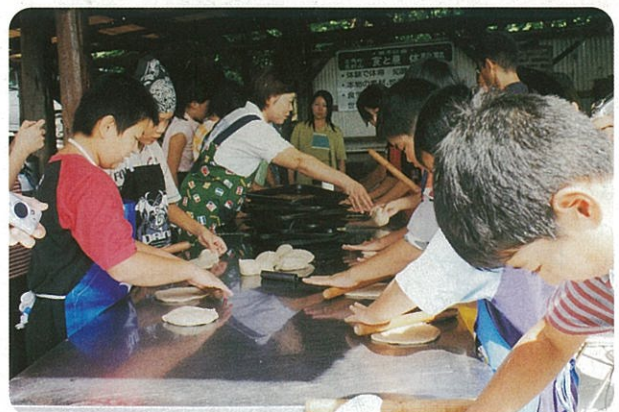
無農薬野菜を使ってピザ作り