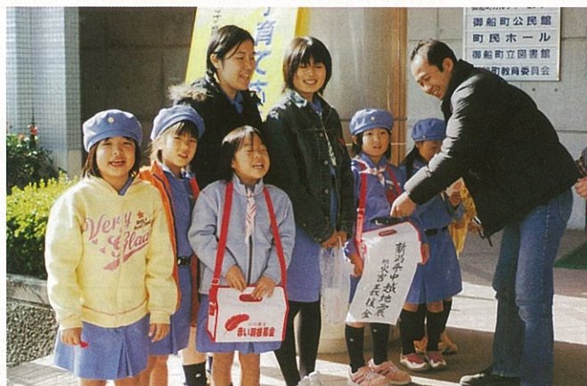
ボランティアのつどい時に、災害義援金活動（赤い羽根街頭募金）をしているガールスカウトの子供達

様々なボランティア活動を実践している人や関心のある人達が全国から集い、情報交換や交流を目的として、グランメッセ熊本を主会場に県内6ブロックで開催されます。その参加者を8月10日まで募集しています。全国のボランティアの方々も熊本に訪れますので、交流してみませんか。 お問い合わせ・お申し込みは御船町社協へ（28210785）