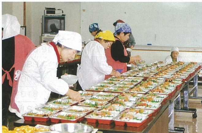
一人暮らし高齢者へ毎年ふれあい弁当を作られている民生委員児童委員の皆さん