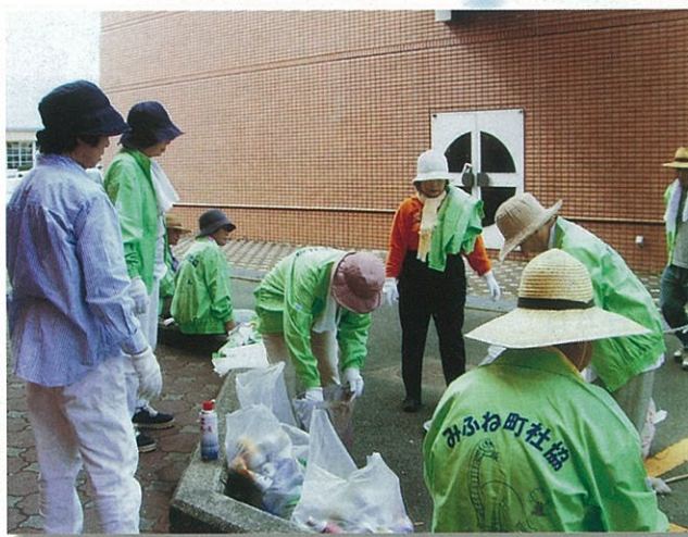
ボランティア連絡協議会による環境美化作業。総勢128名の参加がありました。