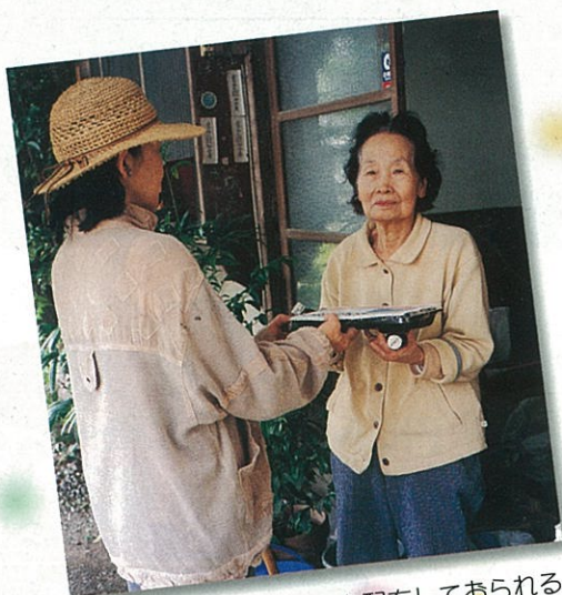
配食サービスのお弁当を配布してられる福祉協力員さん