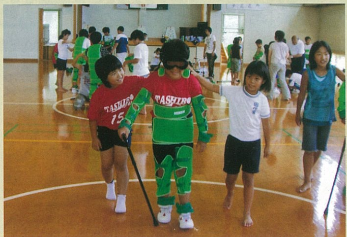
装具を身につけて高齢者疑似体験

私は将来の仕事で福祉関係の仕事にも興味があったのでくまむた荘に来ただけけれど、利用者の方と実際にふれあってみて、コミュニケーションをとるのがさへ難しくくて、