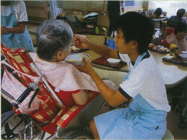
食事介助に緊張しました

絵を書いている人もいました。左手で筆を使ってすっごく上手に絵を書かれるのでとっても驚きました。それに、絵も、もらえました。本当にステキでした。障害者の人でも、普通の人と同じようにされるので、