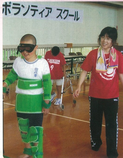
小学生に夏休み期間中、ボランティアスクールを実施しています 写真（左）は高齢者疑似体験の様子