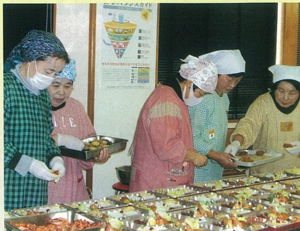
75才以上一人暮らし高齢者へのふれあい弁当は民生委員さんが作られ大変おいしいと喜ばれています。

平成18年度の社協会費は 3,033,500円 でした 社協会費や寄付金は御船町の地域福祉に活用させていただきます。