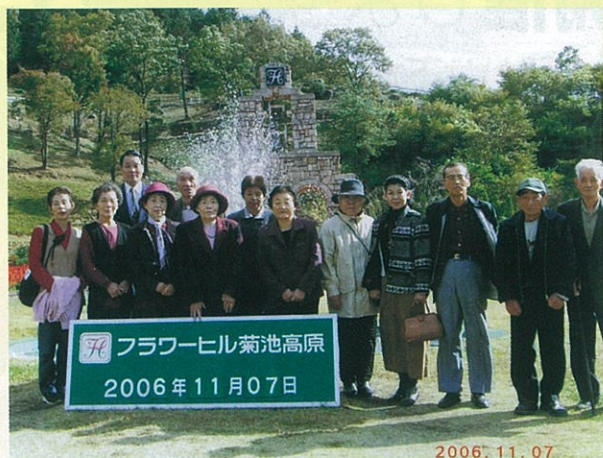
在宅介護者のつどい