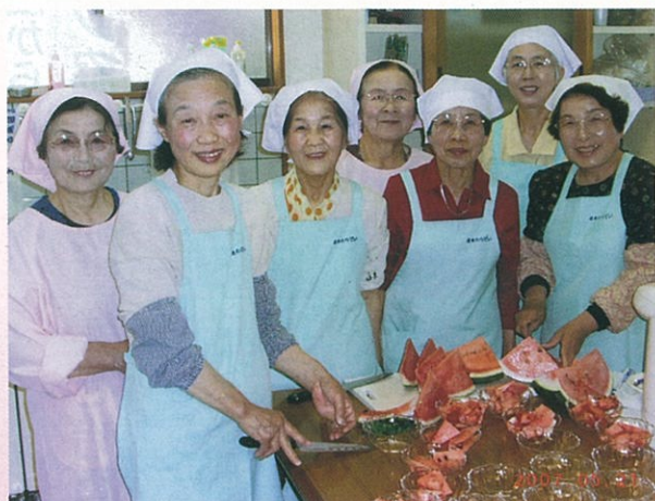
介護予防教室「元気クラブ」に参加されている方達へ昼食を作っておられる食生活改善グループ「さわやか会」と福祉協力員さん。