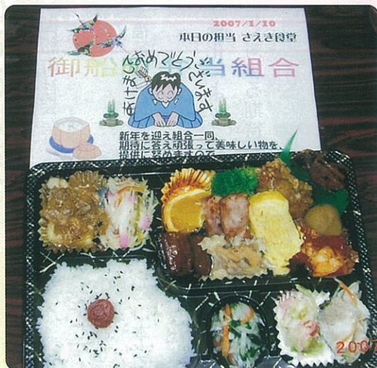
社協（自主事業）では毎週水曜日の夕食を一人暮らしの高齢者宅までお届けしています