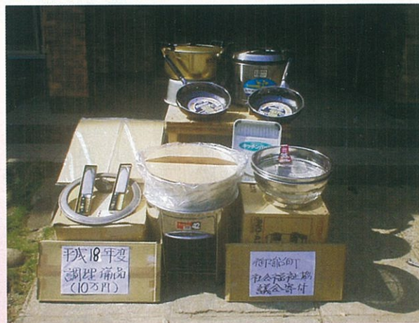
町の公民館(10ヶ所)へ調理器具を配布しました。