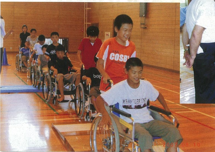
車イス体験では、段差を越える練習をしました。

高齢者ぎじ体験では、体は重いし視界がせまくあまり進めずにいました。七十八十才になるまで後六十年もあつて長いけど高齢者が苦労していることを忘れずにいたいです。ぼくも将来高齢者になるからお年寄りと話したりふれあつたりして元気にさせてあげたいです。