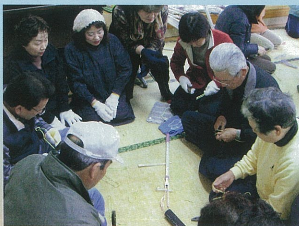
ボランティア連絡協議会であき缶拾い棒作成