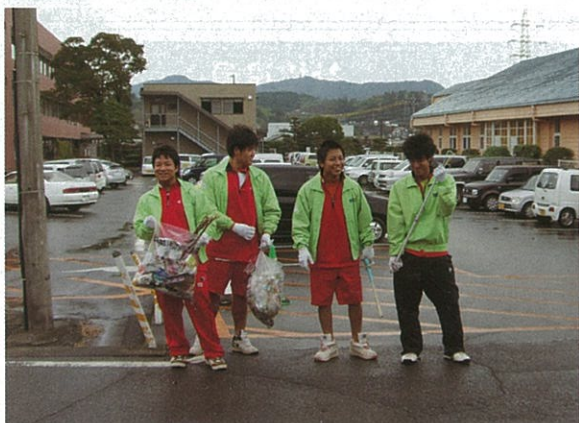
小雨の中たくさんのゴミを集めて帰ってきた御船高校生

社会福祉法人 御船町社会福祉協議会 TEL 282-0785 FAX 282-7895 御船町御船1001-1