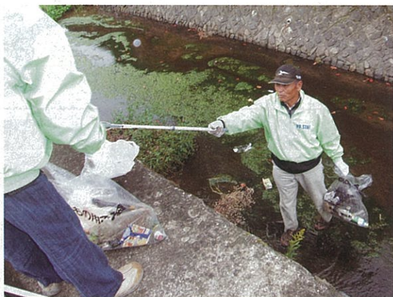
川の中のたくさんのゴミがみるみるきれいになりました。