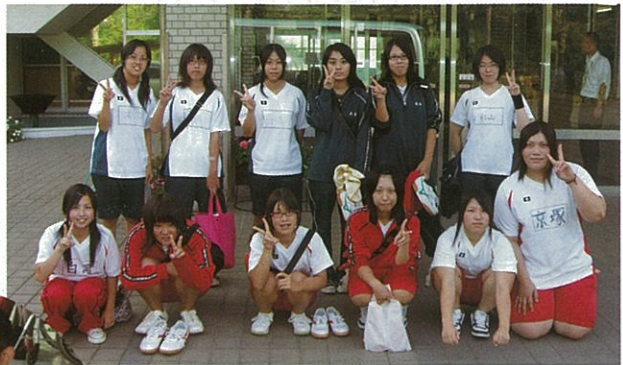
御船高校の皆さん