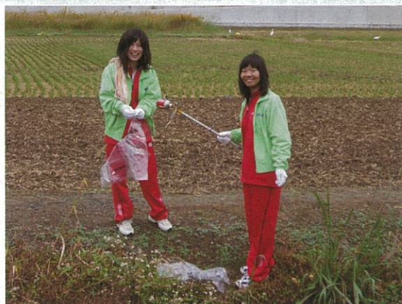
缶ひろい棒も大活躍でした。