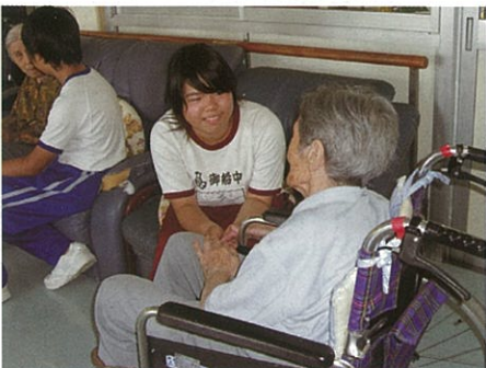
とても嬉しそうにお話しをされる利用者

今回の体験を通して改めて会話の大切さが分かりました。また、利用者の方を第一と考えた接し方も分かりました。今回の体験を将来に生かしていけたらいいなあと思いました。今回はありがとうございました。