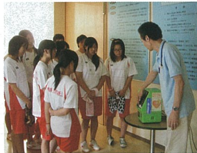
施設内はユニバーサルデザインがあちこちに。