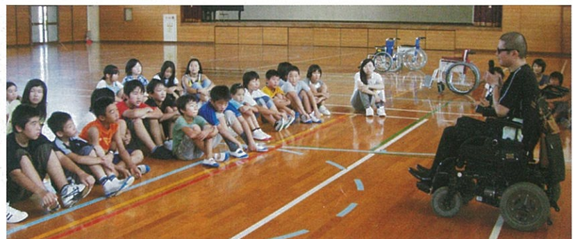
障がいて、かわいそうなこと？マックさんと色々な話をしました。