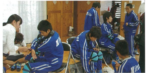
装具をつけて、高齢者、障がい者の体験を行った御船中学生。

友達ととるコミュニケーションとはまた少し違ったコミュニケーションの取り方を知ることができて本当に良かったと思うし、今後の自分にプラスになると思います。