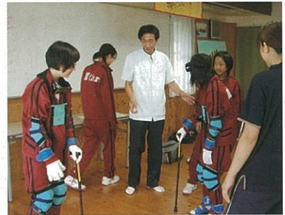
足が思うように動かないのは大変です。