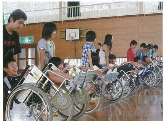
キャスター上げや段差ごえも上手になりました。

僕は実際に乗ってみてやさしくしてもらってうれしい気持ちになりました。僕は店の中や町で車いすに乗っている人を見かけたとき、道を通りにくそうにしている人を無視していました。でも今日の学習をして、無視をせず、困っている人を見かけたら手伝いをしたいという気持ちになりました。また、車いすの人をかわいそうに思わないようにしようと思いました。