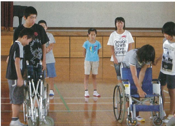
たたみ方、開き方も学びました。