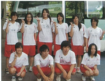
御船高校の皆さん