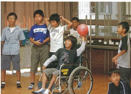
車イスでいろんなスポーツができることも学びました。