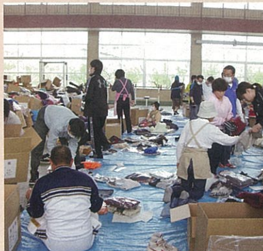
県消防学校に集められた救援物資の 仕分け作業を行う御船町ボランティ アの皆さん