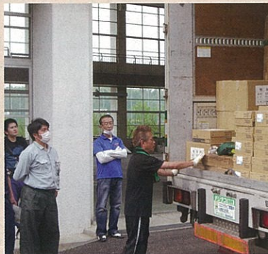
ボランティアの仕分けによりトラック一 杯に積み込まれた救援物資は4/18宮城 県南相馬市などの被災地に届きました。