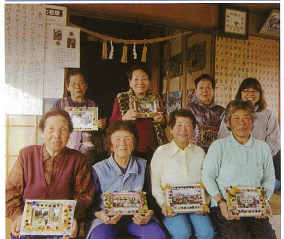
手作りフォトフレームが完成し 笑顔の餅畑会の皆さん