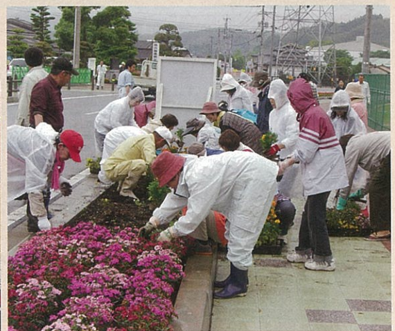
シンボルロードにたくさんの花植えを行った御船町ボラ ンティア連絡協議会の皆さん。