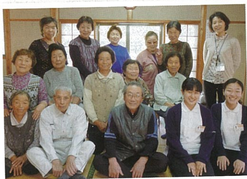
紫陽花サロン(上田代)