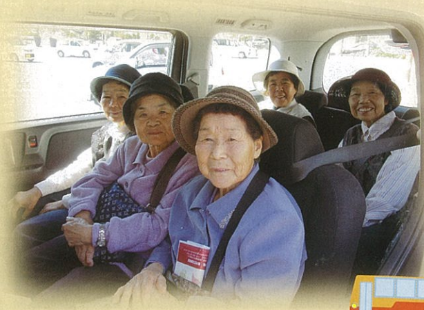
教室参加の間所区の皆さん