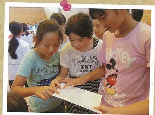
はじめて見る点字に興味津々