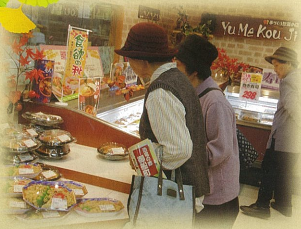
買物も認知症予防に役立ちます