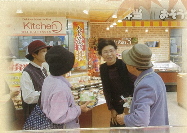
昔のお友達とも会話がはずみます