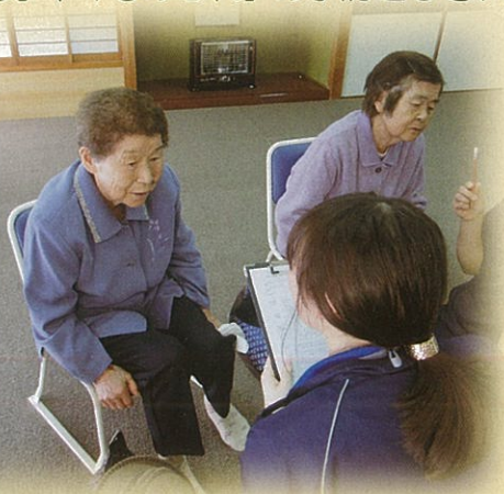
頭の体操にチャレンジ

「閉じこもり」や「もの忘れ」の予防として、体操や認知機能を高めるプログラムを行っています。