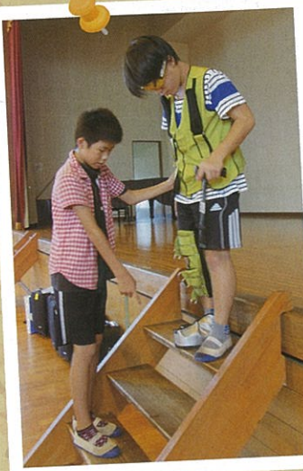
重りをつけて高齢者疑似体験

県の身体障がい者福祉センターから講師を迎え、体験をとおして高齢者や障がいを持つ人の気持ちを学びました。