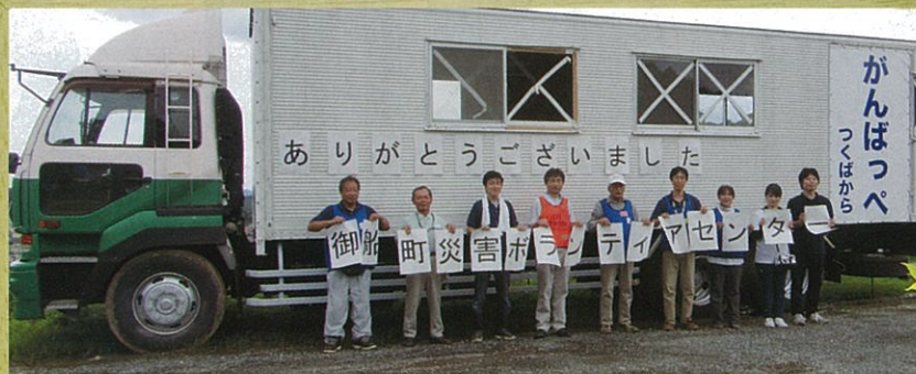
つくばから届いた「がんばっぺ」トレーラーハウス