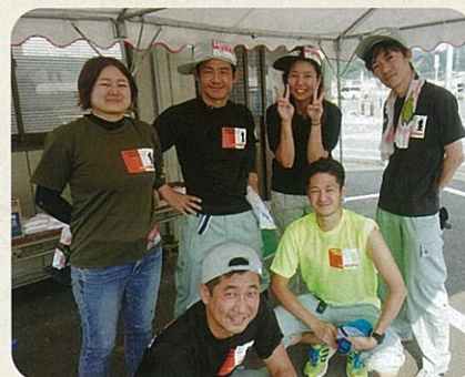
毎週活動の福岡さぶうえいちかまる隊