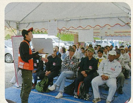
センターでのオリエンテーション