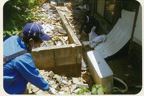
バラバラになったかわらの片付け

御船町社協では4月29日に災害ボランティアセンターを設置し、8月末までに全国から4750名ものボランティアが、720件におよぶご依頼に対応してきました。災害ボランティアは阪神淡路大震災から急速に全国に広まった活動です。「生活空間の復興」につながるご依頼が優先であり、ボランティアが安全に作業できる状況・内容が前提です。そのため危険を伴う作業はご依頼をお断りしたこともありました。