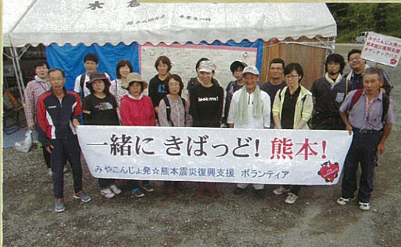
都城市ボランティア