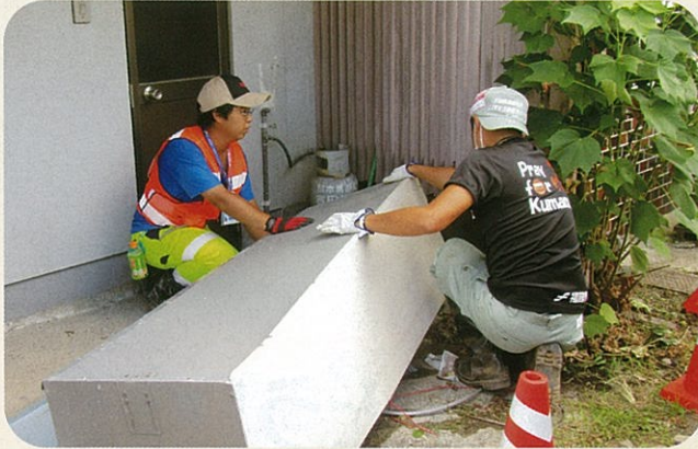
給湯器の運び出し

またセンター開設前に300件の申し込みがあったため、片づけを長くお待たせをしたこともありました。涙ながらにありがとうという声もたくさんいただきました。