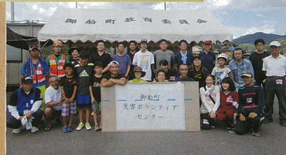
7月23日のボランティア