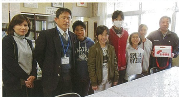
木倉小学校児童会より