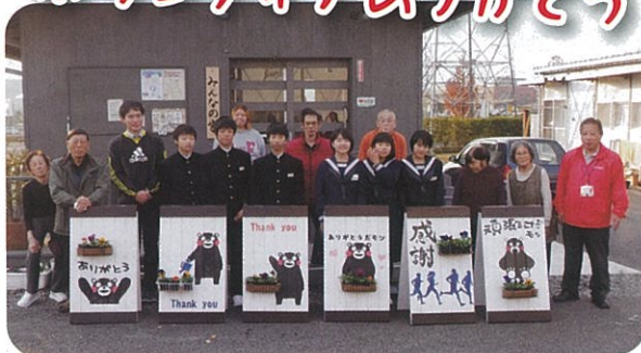
御船中学校2年生が仮設団地に可愛い花壇を贈呈