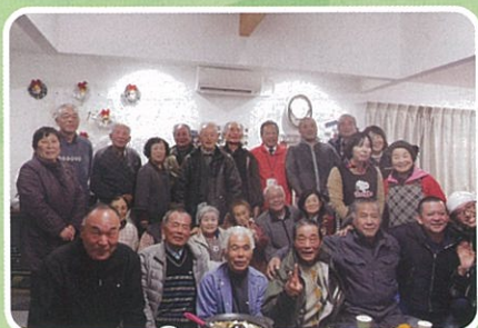
旧七滝中仮設イベント 地区合同の鍋パーティ

地域支え合いセンターでは仮設団地と周辺地域の方との交流の場のお手伝いもしています。