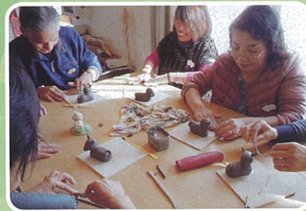
南木倉仮設 粘土細工に挑戦