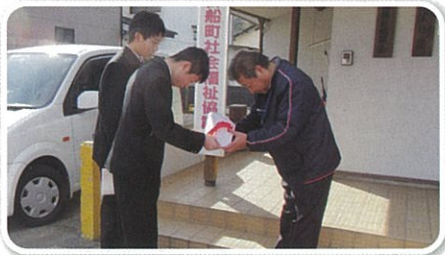
御船中学生徒会より