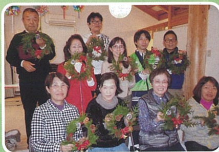
南木倉仮設 みんなでリース作り