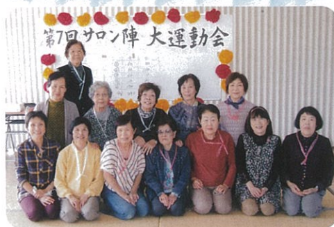
サロン陣（陣区）毎年恒例の運動会でパチリ