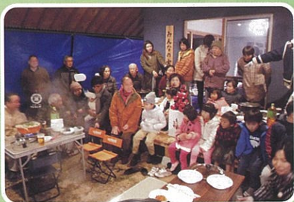
玉虫仮設イベント 祝「みんなの家」が完成