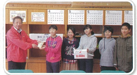
七滝中央小児童会より