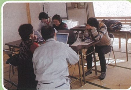
ふれあい第2仮設 パソコン教室