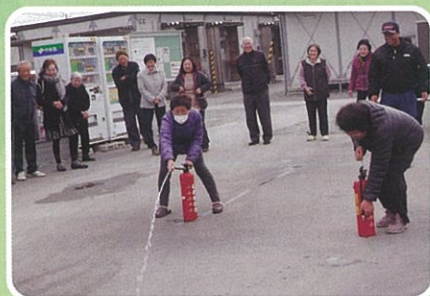
今城仮設 消火訓練