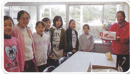
木倉小児童会より