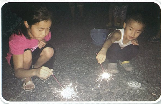
落合こども祭りでは花火（落合仮設団地）

御船町社会福祉協議会 地域支え合いセンター 〒861-3204 上益城郡御船町木倉1176-1 TEL : 096-282-2886 FAX : 096-282-2887