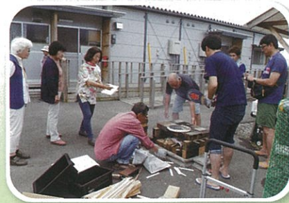
ボランティアや地域とも連携