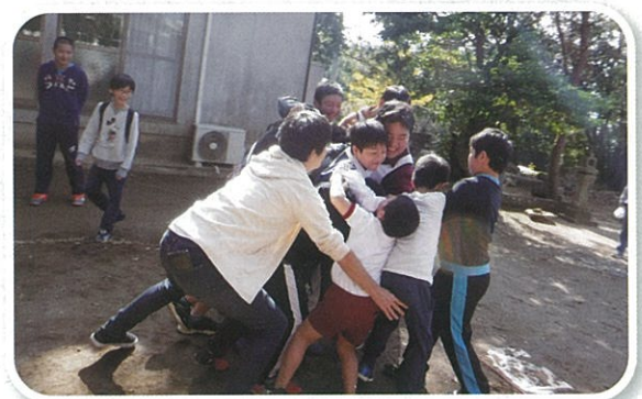
今日も元気な高木っ子（高木ふれあい祭り）