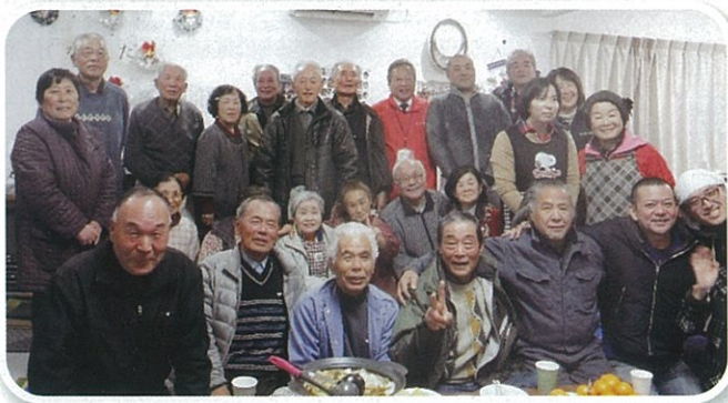
仮設と地域の交流イベント（旧七滝中仮設団地）