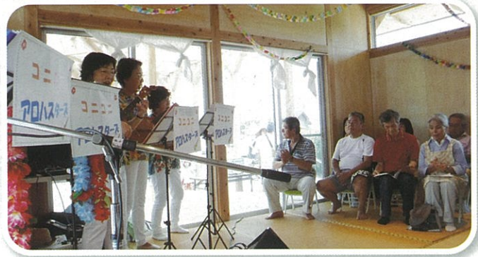
ウクレレでウキウキ（東小坂仮設団地）