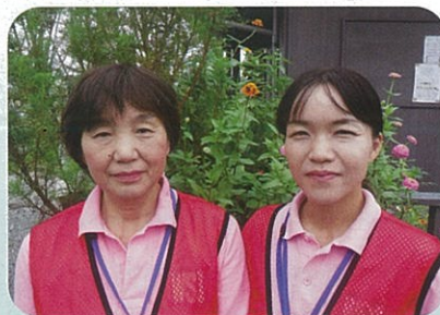
くまもと健康支援研究所