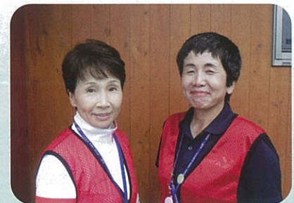
公益財団法人 熊本 YMCA