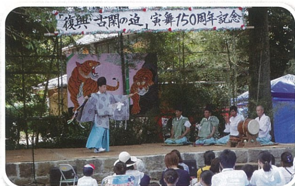
「復興 古閑の迫」寅舞 150周年記念

6月24日(日)に七滝地区で七滝復興祭が、8月26日(日)に上野地区で「復興 古閑の迫」寅舞150周年記念が、地区の方を中心に応急仮設やみなし仮設に入居中の方も地元に戻られて、好天の中、行われました。