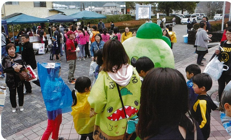
みなし仮設交流会