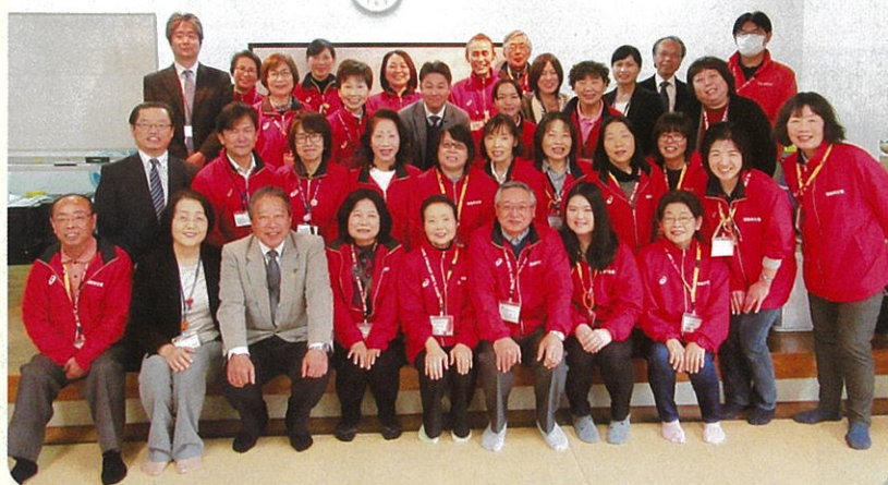
▲地域支え合いセンター全体会

4月からは社会福祉協議会運営の地域支え合いセンターが、その思いを引き継いで支援させていただきます。