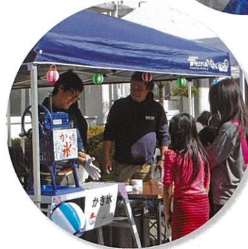
▲滝尾公民館まつり