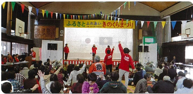
▲ふるさとふれあい木倉まつり