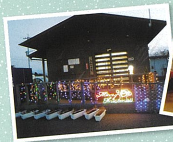
下高野第2仮設 みんなの家のイルミネーション