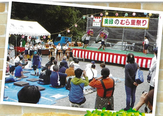
北田代 美緑のむら里祭り