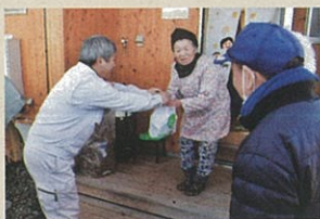
赤飯持参で友愛訪問