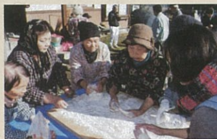
チャリティー餅つき