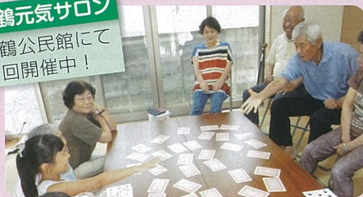
夏休み中のお孫さん達も一緒に参加