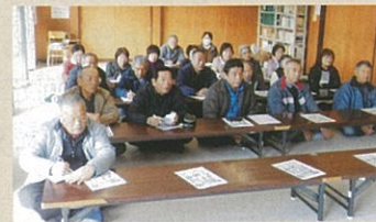
脳梗塞について勉強会