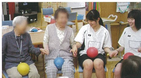
輪になってボールを使ったレクリエーション