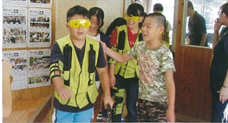
重り、ゴーグル等をつけて高齢者疑似体験

毎年夏休み期間中に実施しているボランティアスクール。今回は県の身体障がい者福祉センターから講師を迎え、体験を通して高齢者や障がいを持つ人の気持ちを学びました。