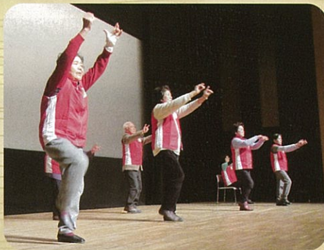
介護予防・生活支援サポーターによる うきうき体操の披露 会場みんなで盛り上がりました。

企業の協力を得て「尿取りパッド」や「生活便利グッズ」の展示と「補聴器体験」もありました。「ボランティア活動」や「元気クラブ」の写真も展示し、活動を知る場となりました。