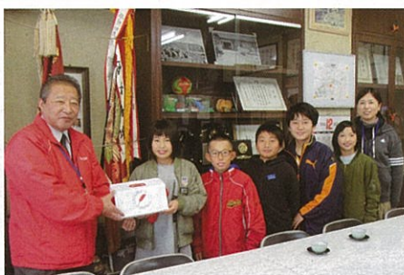
木倉小児童会より