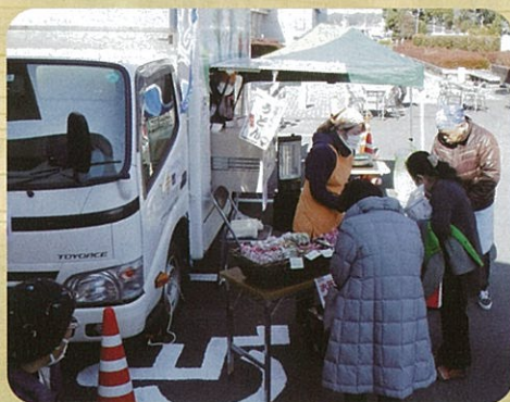
屋外では「ひまわり学園」による 温かいうどんの販売もあり、好評でした。

今回のサロンピックは御船町内の介護施設が送迎を担当して下さいました。この場を借りて御礼申し上げます。