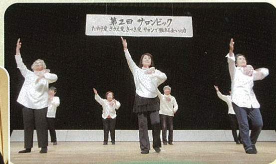
コスモス会(西往還)