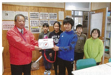
七滝中央小児童会より