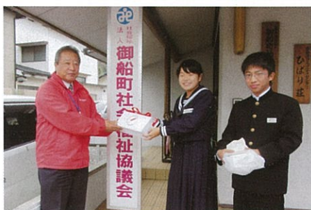
御船中学生徒会より