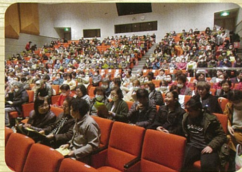
会場いっぱいのお客様 寒い中、ご来場ありがとうございました。