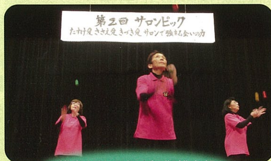
熊本おじゃめの会 御船支部