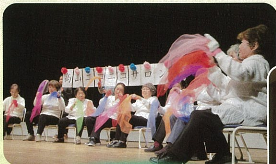
高山ニコニコサロン

去る1月27日、地域サロンのつどい「第2回サロンピック」を開催し、約400名の参加がありました。日頃の活動をステージで披露され、地域の力と絆を感じたサロンピックでした。