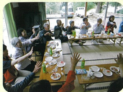
古閑迫区顔合わせ会の様子