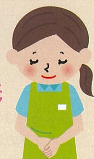
田中 早苗氏 (木倉地区)