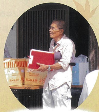
出発式 会長より説明