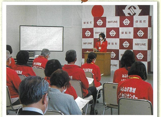
活動の思い出を語るセンター職員