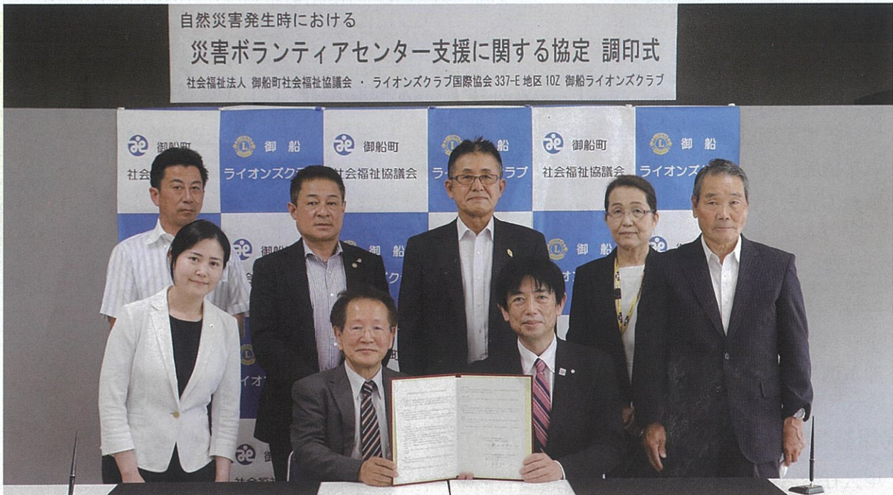
自然災害発生時における 災害ボランティアセンター支援に関する協定 調印式 社会福祉法人 御船町社会福祉協議会 ・ ライオンズクラブ国際協会 337-E 地区 10Z 御船ライオンズクラブ

社会福祉法人 御船町社会福祉協議会 TEL 282-0785 FAX 282-7895 御船町御船1001-1