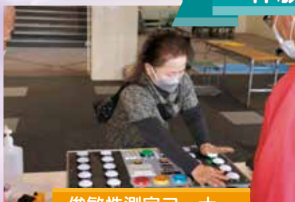
俊敏性測定コーナー