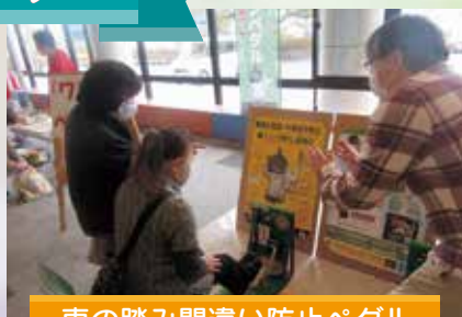
車の踏み間違い防止ペダル