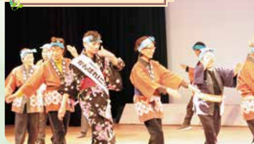
西木倉サロンげんき塾