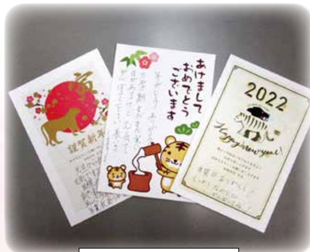
高齢者からの温かなお返事