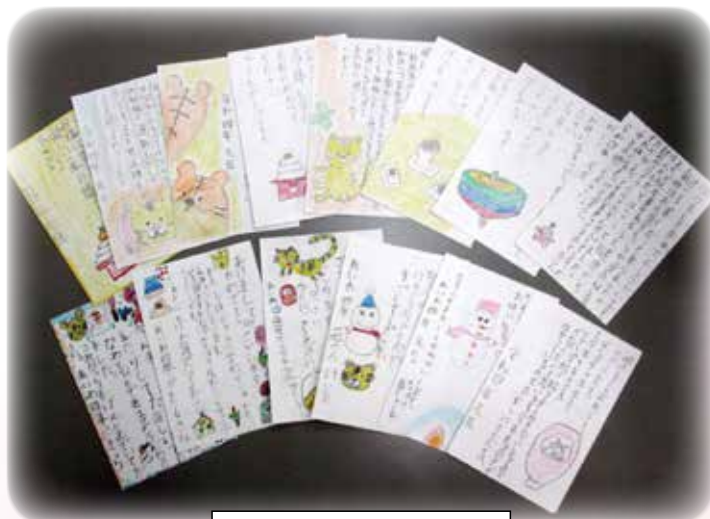
児童からの素敵な年賀状