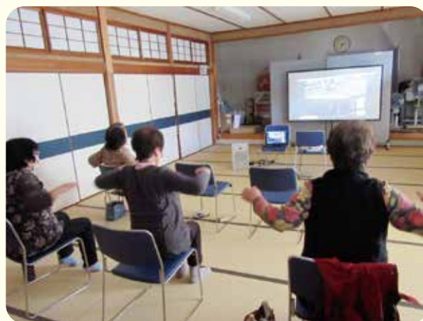
参加者の宗心原サロンの皆さん